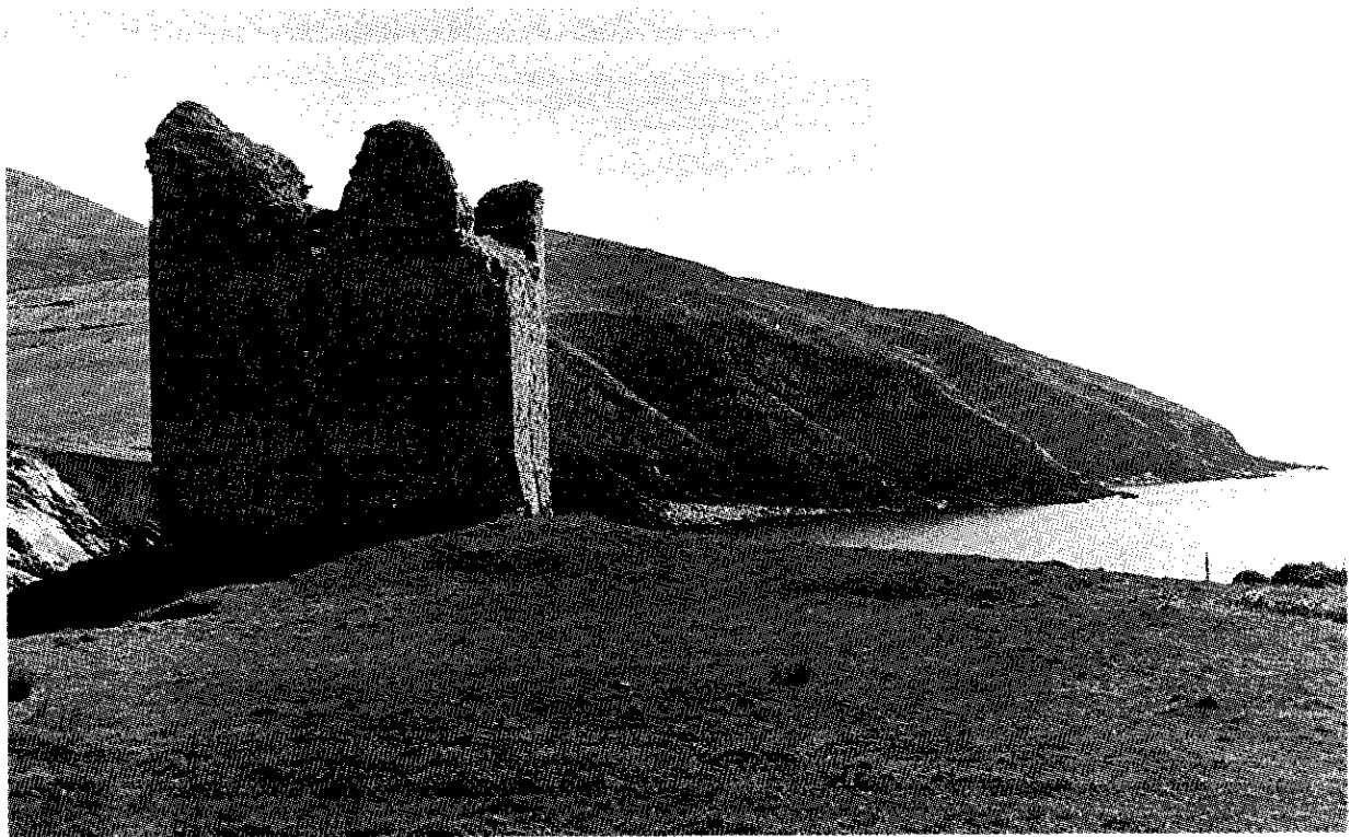
Caisleán na Minairde